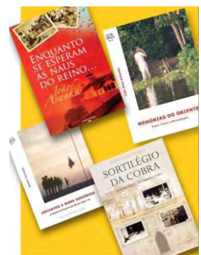
Convite para o 6º ciclo da tertúlia Fim do Império.