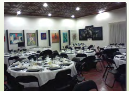
Sala Aljubarrota do Museu do Combatente, decorada para o jantar de 9.01.2011.

No dia 9 de Dezembro de 2011, o Museu do Combatente e Forte do Bom Sucesso recebeu o Jantar de Natal de uma das agências do BBVA Portugal. O jantar foi realizado pelo Fora de Casa Catering e contou com oitenta participantes. Ao longo da noite o evento foi pautado por muita animação através de uma sessão de karaoke e que terminou com a largada simbólica de balões iluminados, por cada um dos participantes.