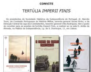
Convite para a tertúlia Imperii Finis.