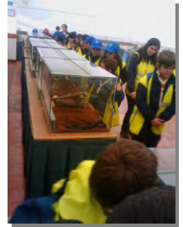
Visita dos grupos escolares à exposição Micro-Safari.

De 1 a 31 de Dezembro de 2011 o Museu do Combatente recebeu a visita de vinte e cinco grupos escolares e outras associações à exposição temporária "Micro-Safari" e exposições permanentes do "Combatente Português do Século XX" e da "História da Aviação Militar". Foi o caso da EB1/JI Salesiano Oleiro de Almada, da Casa de São Vicente, do Centro Soc. Paroquial São Domingos de Rana, da Escola Paula Vicente, do IASFA (Oeiras), do Jardim Infantil "A Bolinha", da Escola "Pequenos Infantes", da EB1 Feijó, do ATL Jardim Florida, entre outros.